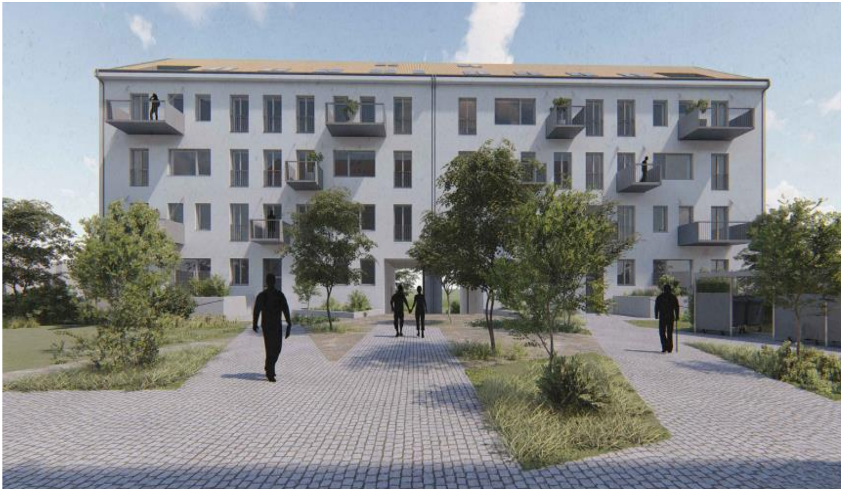
Pohled z vnitrobloku na návrh průchodu zadním bytovým domem