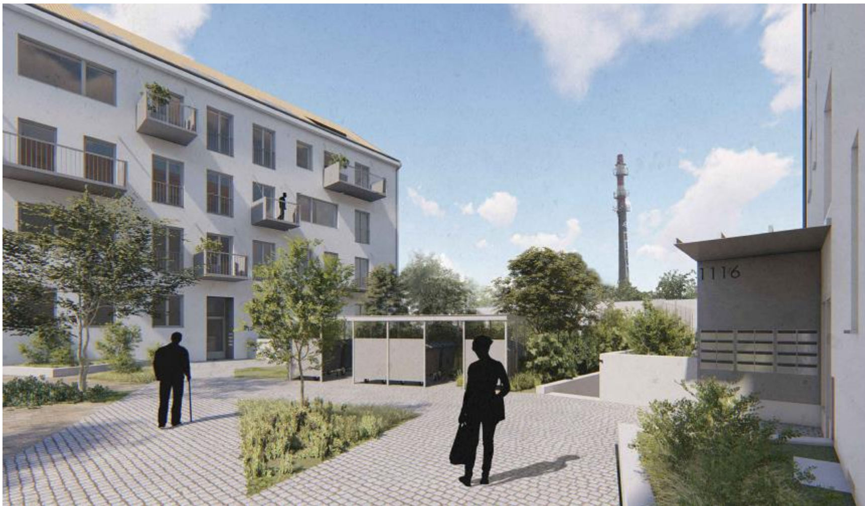
Pohled do vnitrobloku