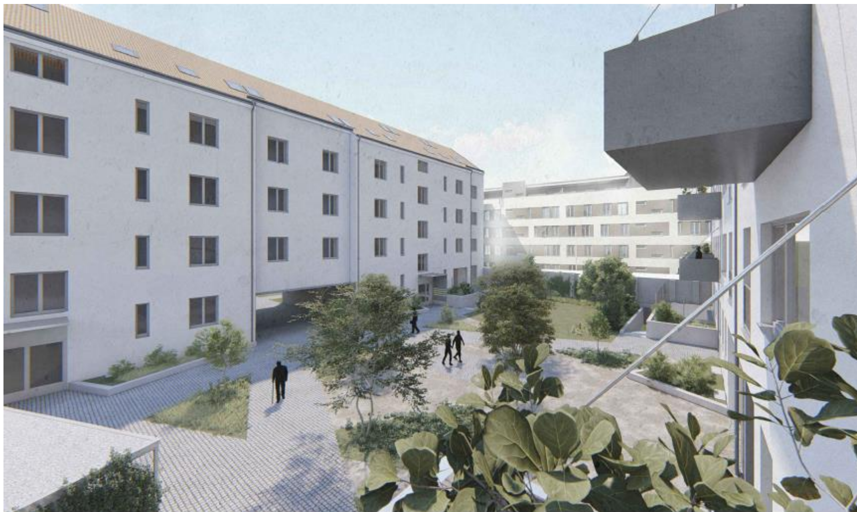
Pohled do vnitrobloku