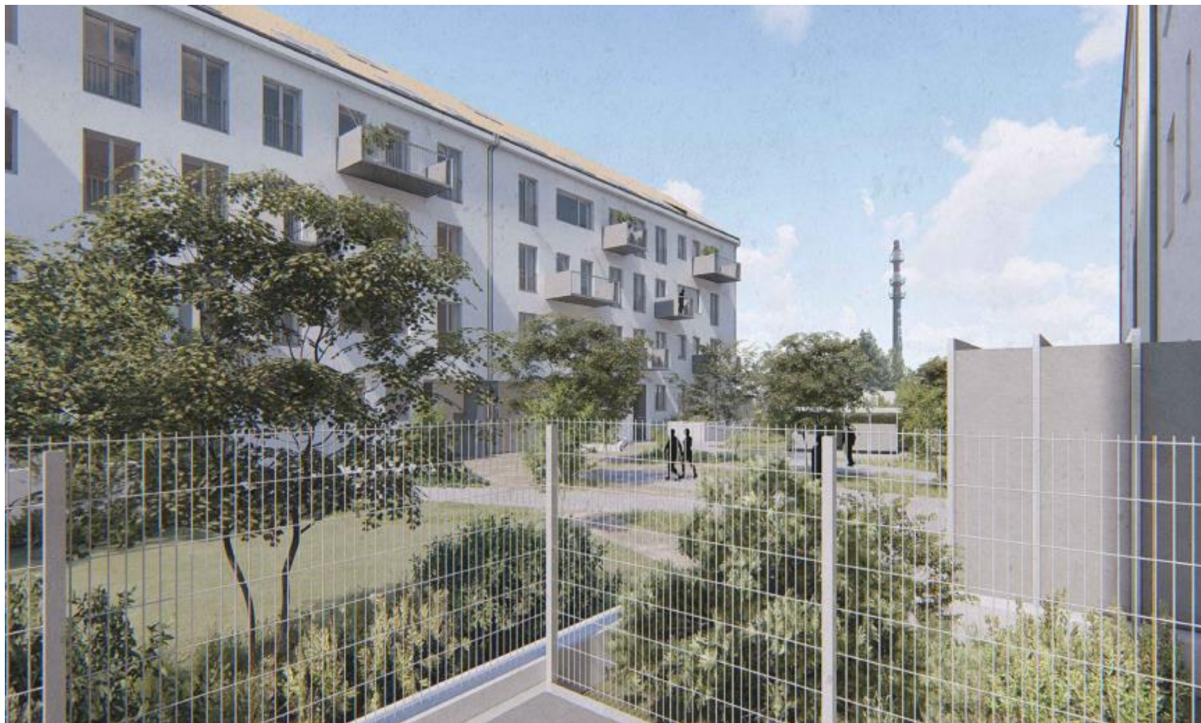
Pohled do vnitrobloku