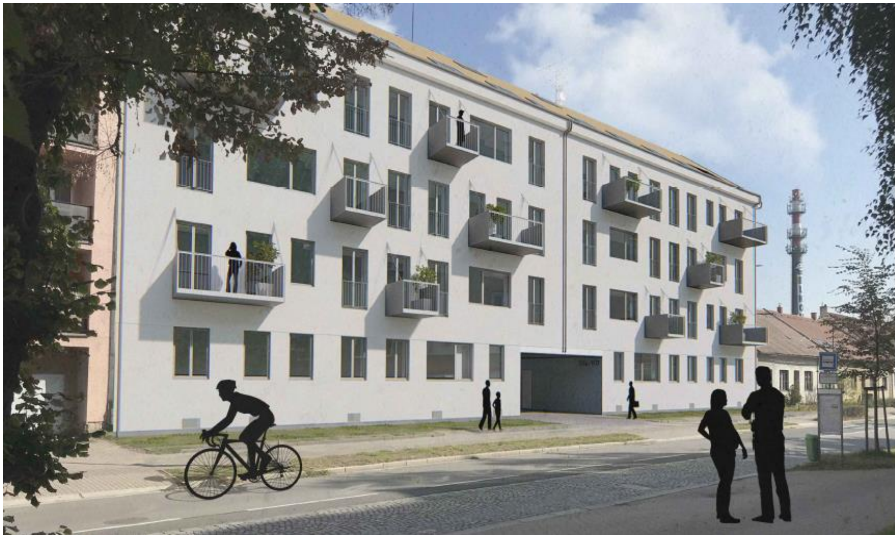
Pohled z ulice na bytové domy Husova 1116 - 1119